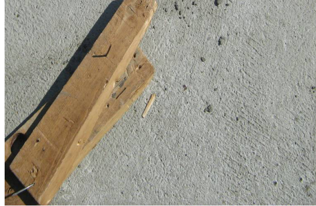
Ekser u dasci

Posebnu pažnju posvetiti kretanju kroz gradilište. Izbegavati neobezbeđena mesta (ivice objekta, otvore i sl.) Ukoliko primetite ovakva mesta, obavestite odgovorno lice. Nije dozvoljeno samovoljno izdvajanje iz grupe. Ne zaboravite da najveći deo povreda nastaje prilikom kretanja kroz gradilište.